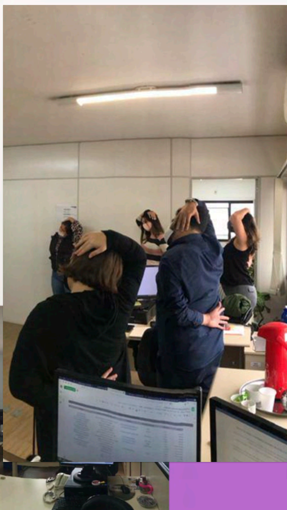
Servidores praticando ginástica laboral