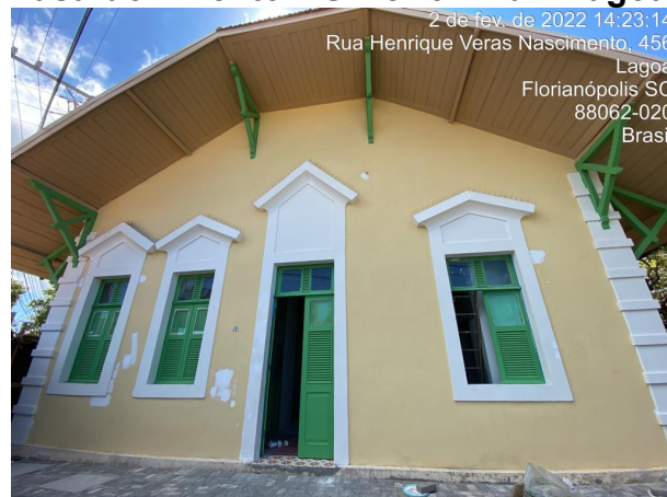
SMTAC acompanha obras do Casarão Bento Silvério

A Secretaria Municipal de Transparência, Auditoria e Controle (SMTAC) realizou, no dia 02 de fevereiro, mais uma visita as obras de restauração e revitalização do Casarão Bento Silvério, localizado na Rua Henrique Veras do Nascimento, no bairro Lagoa da Conceição.