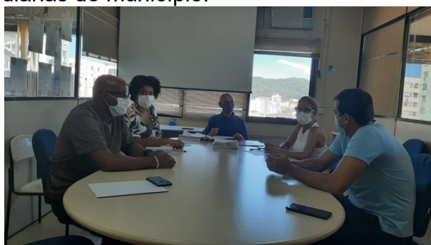
Treinamento é realizado na SMTAC

Conforme Instrução Normativa do TCE/SC, a SMTAC é responsável pela emissão do parecer do órgão de controle interno das prestações de contas de diárias do município.