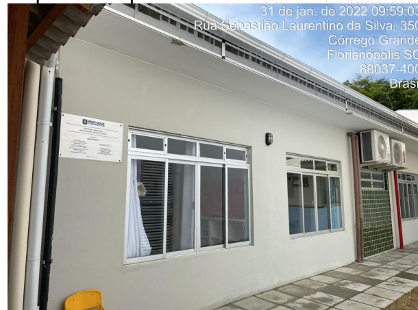
Obras do NEIM Fermínio receberam visita da SMTAC

A visita contou com a presença da Secretaria Municipal de Educação, que foi representada pelo fiscal de contrato responsável pela obra.