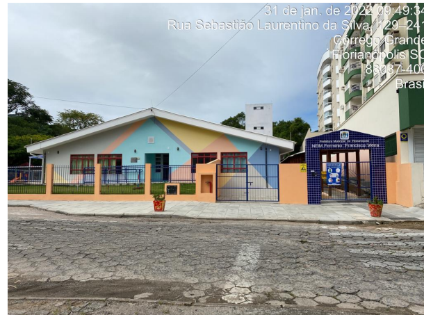
Obras do NEIM Fermínio receberam visita da SMTAC

No dia 31 de janeiro, a Secretaria Municipal de Transparência, Auditoria e Controle (SMTAC) esteve presente nas obras de reforma e ampliação do Núcleo de Educação Infantil Municipal Fermínio Francisco Vieira, localizado no bairro Córrego Grande.