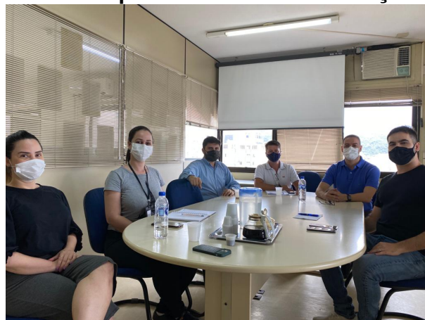
Reunião foi realizada na SMTAC

No dia 04 de fevereiro a equipe da Secretaria Municipal de Transparência, Auditoria e Controle (SMTAC) recebeu a Superintendente de Licitações e Contratos para uma reunião com os representantes da empresa que fornece o sistema de Licitação para a administração pública.