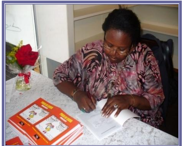
Lançamento: Pingo de chuva – Menina falante