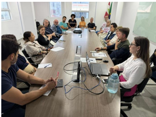
CGM recebe entidades para orientação

Na oportunidade foram realizados três reuniões com grupos de representantes de entidades, que tiveram como objetivo orientar quanto ao regulamento para apresentação das Prestações de Contas dos recursos repassados aos projetos executados em parceria com o município.