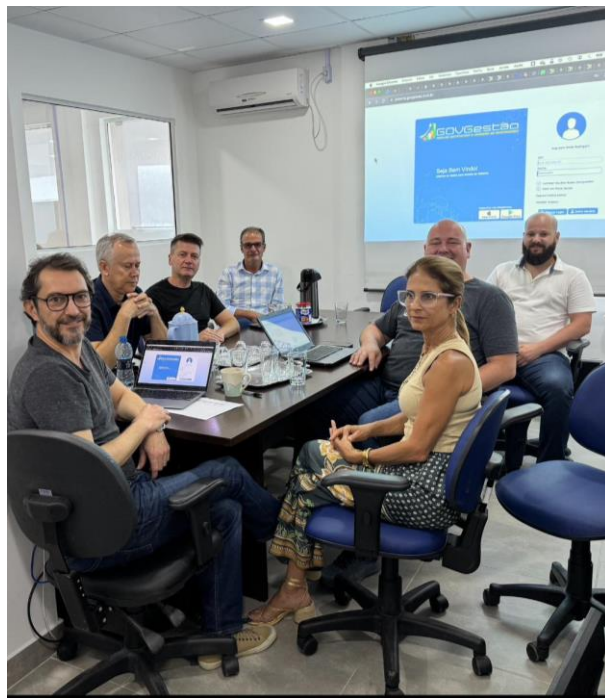
CGM recebeu treinamento do sistema Pública

Técnicos da Controladoria participaram no dia 20 de dezembro, de um treinamento para utilização do novo sistema de Controle Interno da CGM.