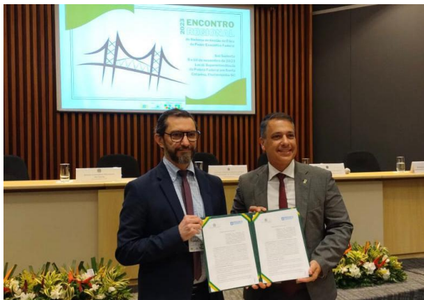
Acordo foi assinado no dia 09/11

A Prefeitura de Florianópolis, por meio da Controladoria-Geral do Município (CGM), formalizou na quinta-feira, 09/11, um Protocolo de Intenções com a Comissão Nacional de Ética Pública (CEP). No mesmo evento, a Controladoria-Geral do Estado (CGE/SC) também firmou a parceria, cujo objetivo é ampliar o debate sobre ética e conflito de interesses no poder público das três esferas de governo.