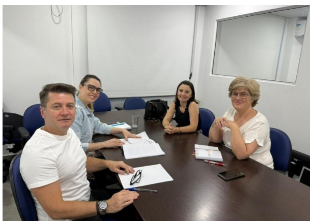
Reunião foi realizada dia 18 de dezembro

O programa tem como uma de suas finalidades garantir maior eficiência e celeridade no atendimento das demandas emergenciais das Unidades Educativas da Rede Municipal.