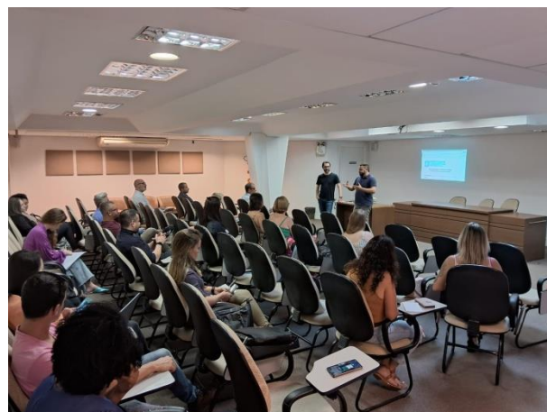
Encontro foi realizado no auditório da SEMAS

Com o relatório anual setorial, a Ouvidoria Geral do município terá informações gerenciais que permitirão a atuação direta em possíveis do Sistema de Ouvidoria do Poder Executivo Municipal de Florianópolis (SisOuv), e assim a busca de soluções que tenham como objetivo ampliar a qualidade e a eficiência dos serviços oferecidos aos cidadãos. O prazo para a entrega do relatório por parte das setoriais é dia 9 de fevereiro de 2024.