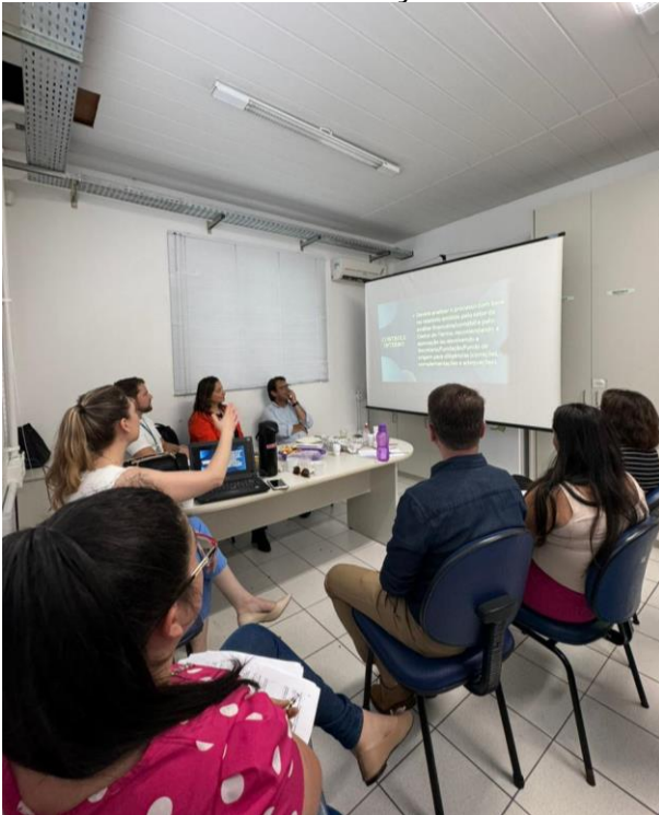
Treinamento foi realizado na Saúde

No dia 30 de novembro, a Controladoria-Geral do Município realizou uma reunião de orientação para as comissões e gestores da Secretaria Municipal de Saúde, para orientar na análise das Prestações de Contas dos recursos repassados através de subvenções, auxílios e contribuições para as OSCs.