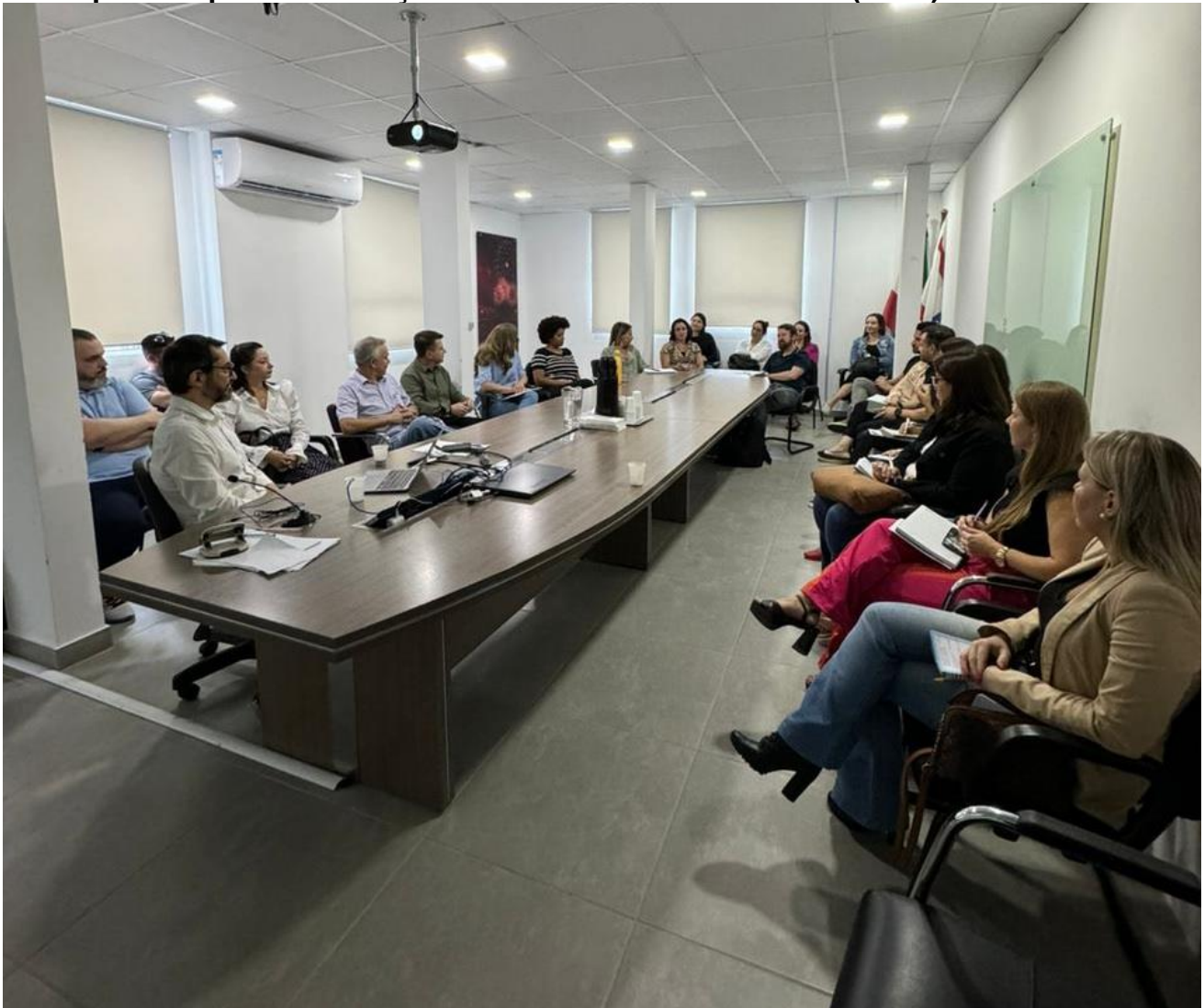
Primeira reunião do Núcleo Municipal de Operacionalização do Controle Interno Setorial foi realizada no dia 10 de novembro

Controladoria-Geral do Município realiza primeira reunião com a equipe do Núcleo Municipal de Operacionalização do Controle Interno Setorial (NCIS)