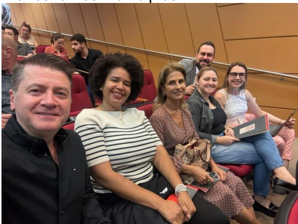
Curso foi realizado no TCE/SC

Entre os temas abordados no encontro estiveram, comunicação processual, achados de auditorias e auditoria financeira nos municípios.