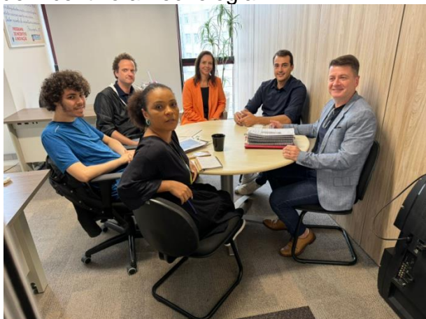
Reunião ocorreu no dia 28 de novembro

A CGM visitou a Secretaria Executiva de Desenvolvimento Econômico, Ciência e Tecnologia no dia 28 de novembro, em reunião que tratou sobre os projetos realizados em virtude da Lei de Incentivo à Tecnologia. O encontro serviu para alinhar os regramentos dos projetos e orientar a equipe que trata das parcerias firmadas pelo município em virtude da Lei de Incentivo a Tecnologia.