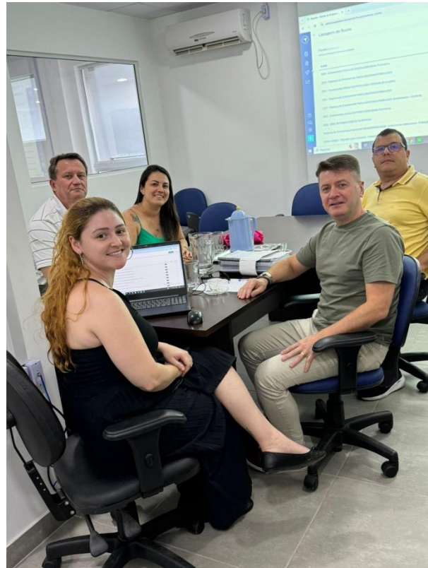
Reunião ocorreu no dia 19 de dezembro

No dia 19 de dezembro, técnicos da Controladoria-Geral do Município (CGM) se reuniram com representantes da Secretaria Municipal de Licitações, Contratos e Parcerias e da Secretaria Municipal de Assistência Social, para realizar o alinhamento de apresentação das propostas de Leis de Incentivo no Sistema Integrado de Gestão de Parcerias.