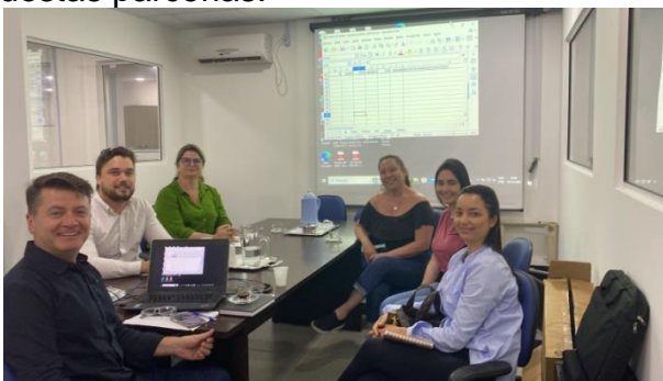
Encontro ocorreu na CGM

O objetivo foi alinhar a análise dos projetos, bem como a análise financeira destas parcerias.