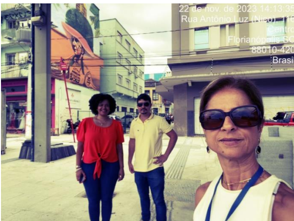
Visita foi realizada no dia 11 de novembro

As visitas de monitoramento e avaliação a este contrato seguirão sendo realizadas até a conclusão dos serviços contratados pela Prefeitura, através da Secretaria Municipal de Infraestrutura.