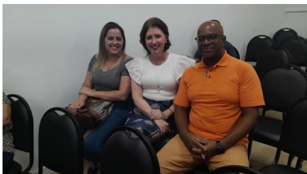
Treinamento foi realizado no dia 1º de dezembro

A equipe do Controle Interno participou, no dia 1º de dezembro, do treinamento para utilização de novo sistema de registro de ponto dos servidores do município. O novo sistema teve início no mês de dezembro e tem como objetivo ampliar a segurança na gestão do ponto dos servidores.