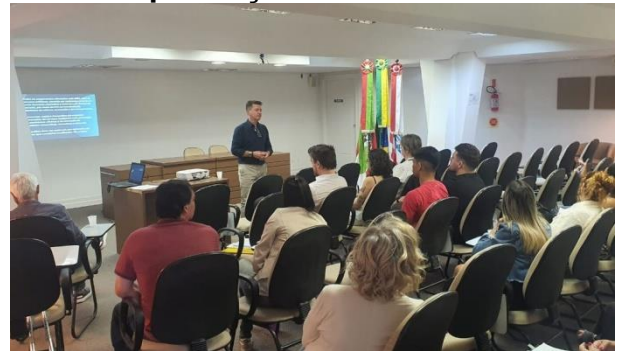
Formação foi realizada no dia 23 de novembro

A equipe do Controle Interno realizou, no dia 23 de novembro, mais um curso de orientação sobre Prestação de Contas de recursos repassados através de subvenções sociais, auxílios e contribuições, para as Organizações da Sociedade Civil (OSCs) que possuem parceria com o município.