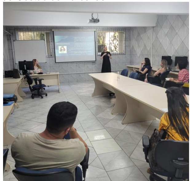
Treinamento realizado no dia 12/12

No encontro do dia 12, o treinamento foi sobre prestação de contas de recursos repassados através de subvenções, auxílios e contribuições. A formação apresentou a legislação sobre o tema e também uso prático do sistema Integrado de Gestão de Parcerias.