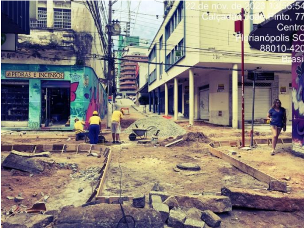
Obras no Centro-Leste

No dia 11 de novembro, a Controladoria-Geral do Município (CGM) realizou uma nova fiscalização para monitoramento e avaliação das obras de revitalização e drenagem das ruas do Centro-Leste, do entorno da Praça XV de Novembro e do entorno do Terminal Cidade de Florianópolis.