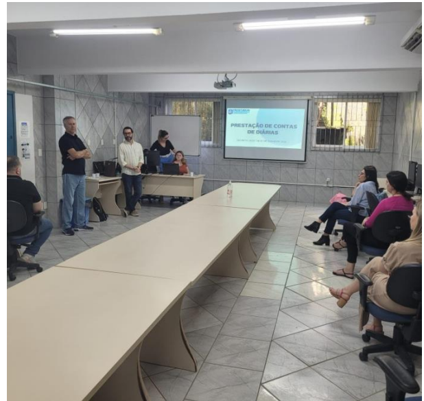
Treinamento realizado no dia 06/12

A equipe do Núcleo de Controle Interno Setorial esteve reunida nos dias 06, 07 e 12 de dezembro para treinamento com a equipe da Controladoria-Geral do Município (CGM).