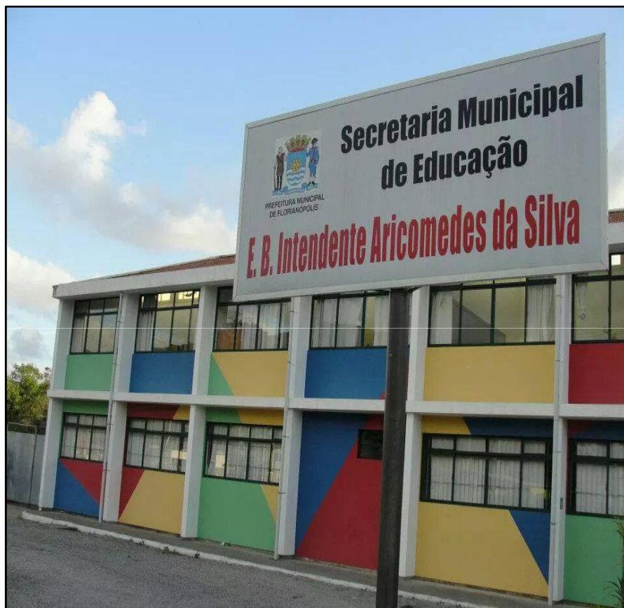
Fachada da escola. Imagem disponível no facebook da EBIAS. 2018