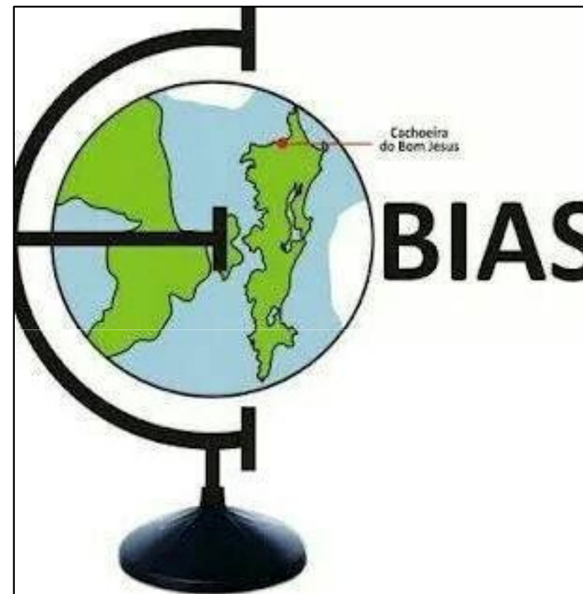
Logomarca da EBIAS. Imagem disponível no facebook da EBIAS. 2018