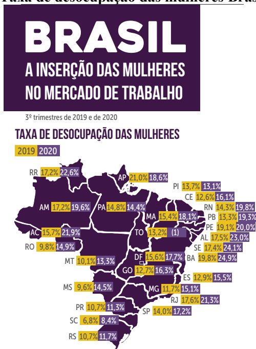
Quadro 1 – Taxa de desocupação das mulheres Brasil - 2019/2020

Dados da Pesquisa Nacional por Amostra de Domicílios Contínua (Pnad Contínua) - IBGE Elaboração: DIESE Nota: (1) A amostra não comporta a desagregação para esta categoria