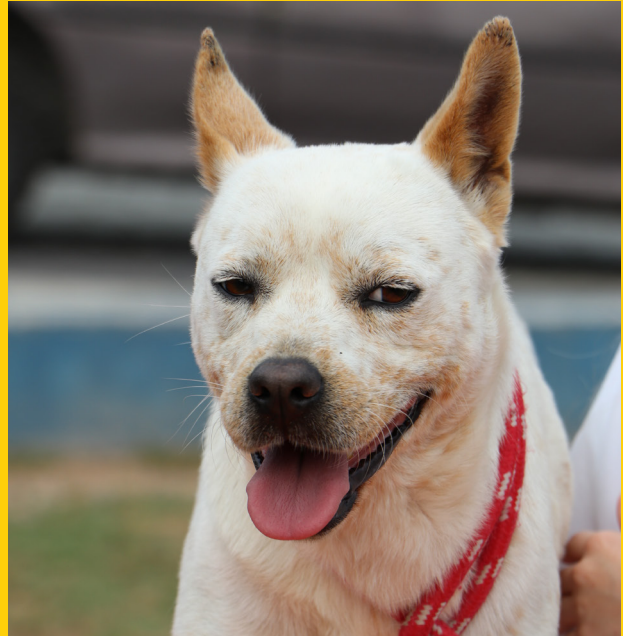
Sansão - macho