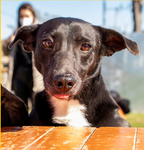
Juca - macho