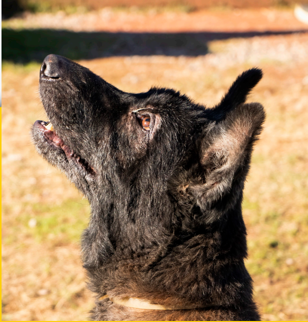
Bop - macho