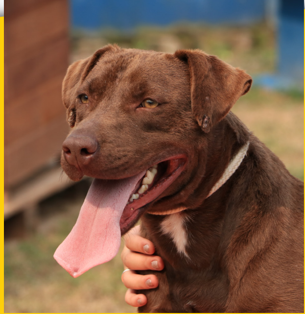
Astor - macho