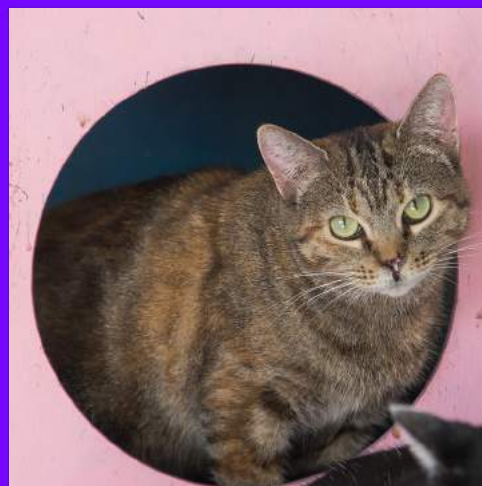
Torrada - fêmea