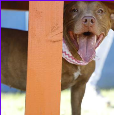
Aika - fêmea (pit bull mestiça)