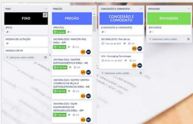
Software online "Trello"

O Gabinete da Secretaria de Administração, em parceria com o Setor de Contratos da Diretoria de Gestão Administrativa, implementou um painel de controle dos contratos, buscando mais agilidade na construção, no acesso às informações e no controle de valores e prazos dos contratos de responsabilidade da Secretaria de Administração.