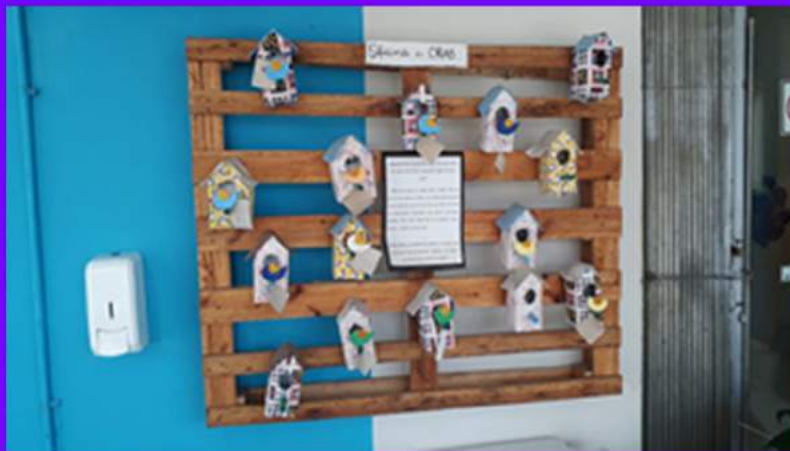
Em cada CRAS, diferentes oficinas são oferecidas para a população.

Atualmente o município de Florianópolis possui 10 CRAS - Centro de Referência de Assistência Social. A escolha dos locais onde os Centros estão situados não é feita à toa. O objetivo é que os CRAS estejam localizados em áreas de maior vulnerabilidade social, para que possam servir de porta de entrada para os serviços de assistência social para as famílias.