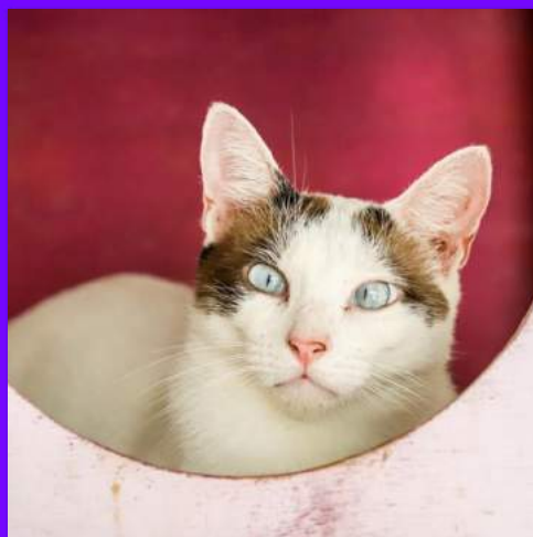
Laio - macho